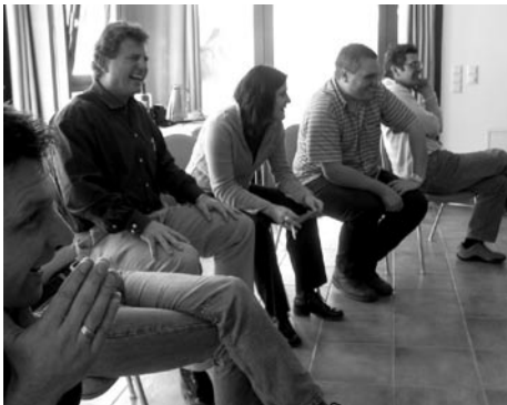
Abb.2: Spannende Darbietungen ...

Die Epochenberichte werden nicht diskutiert, es sind lediglich Verständnisfragen und kurze Antworten zugelassen. Der Moderator fotografiert einige Szenen der Darbietungen und integriert die Bilder später in das Fotoprotokoll.