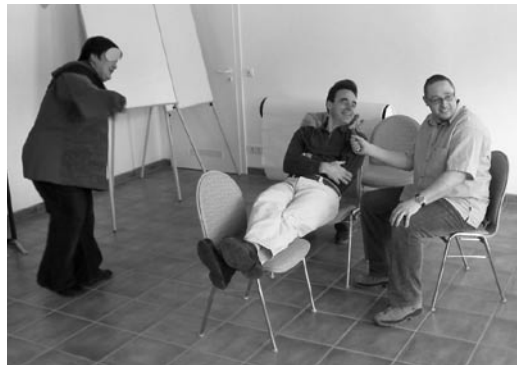
Abb. 3: ... sorgen für ausgelassene Stimmung